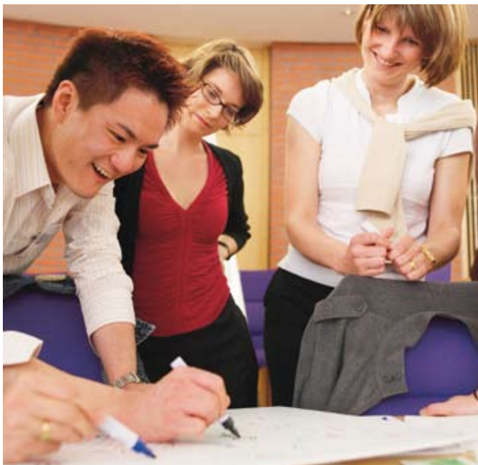
Réunion produit : développement et partage de compétences chez L'Oréal à Paris (France).