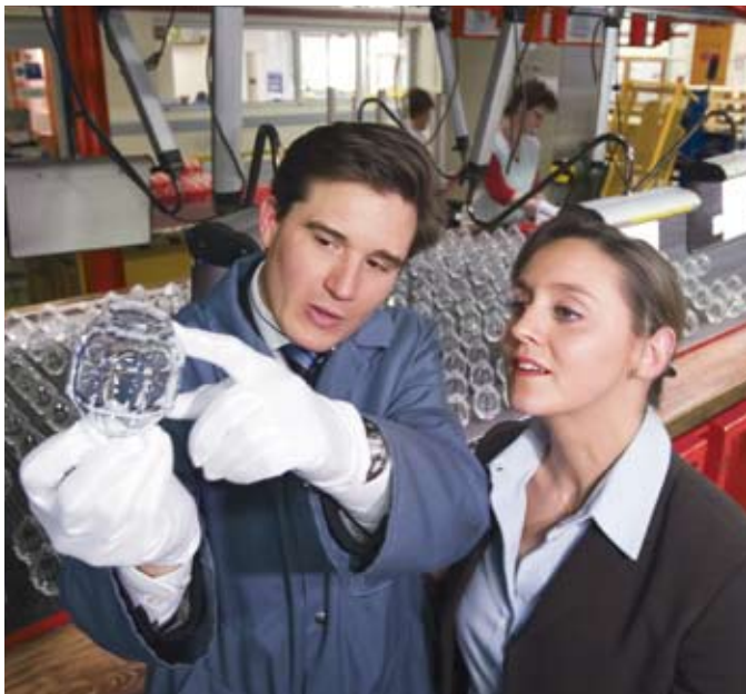
Un acheteur L'Oréal avec son fournisseur, spécialisé dans la réalisation de flacons de parfum en verre (France).

Le groupe veille au strict respect des normes de travail et des droits de l'homme dans toute la chaîne d'approvisionnement. Chaque année, plusieurs centaines d'audits sont réalisés par des experts indépendants afin de vérifier que les conventions internationales en matière de droit du travail sont effectivement appliquées chez tous nos fournisseurs.