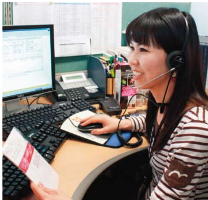
Centre de conseils aux consommateurs (Corée).

L'Oréal publie chaque année en juin un Rapport Développement Durable, disponible sur le site www.loreal.com ainsi qu'une version abrégée qui constitue un résumé de ce rapport.